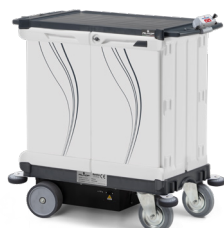
EMOTION DRIVE Art. SE0400020PE02 110x64x110,5 cm