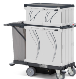
EMOTION DRIVE Art. SE0305020PE00 154x64x149,5 cm