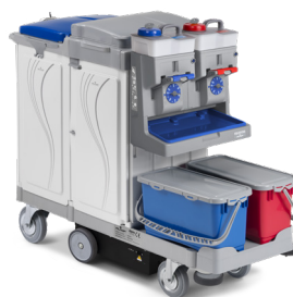
ALPHA DRIVE Art. MA3848711UD00 153x58x120 cm