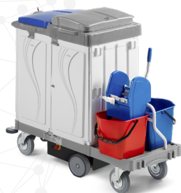
ALPHA DRIVE Art. MA3848400U002 139x68x120 cm