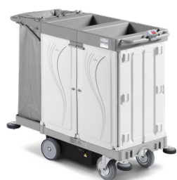
ALPHA HOTEL DRIVE Art. HA0648003U000 142x58x114 cm