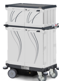
EMOTION DRIVE Art. SE0304020PE00 110x64x149,5 cm