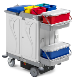
ALPHA DRIVE Art. MA0848703U000 120x58x124 cm