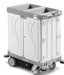
ALPHA HOTEL DRIVE Art. HA0648005U000 97x58x114 cm