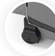
Roues standardes Standard Rädern