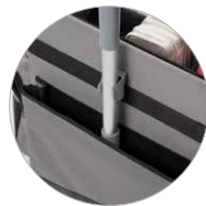
Poche latérale avec crochet pour manche Seitliche Tasche mit Velcro Verschluss