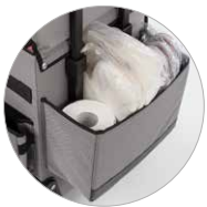
Poche arrière multiusage avec séparateurs mobiles Internes Fach mit beweglichen Trennungen