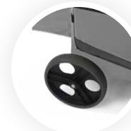
Roues axiales Axialrädern