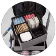
Cassette avec séparateurs mobiles Kleine Wanne mit beweglichen Trennungen