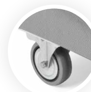
Roues de Ø 80 mm et structure en Rilsan Ø 80 mm Räder und Rilsanstruktur