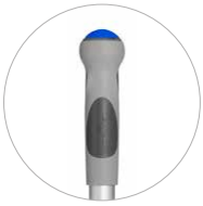
Manche télescopique Teleskopstiel