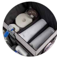
Compartiment avec séparateurs mobiles Hintere Tasche mit beweglichen Trennungen