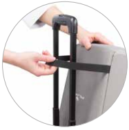
Bande élastique Gummiband