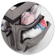
Poche frontale avec fermeture à glissière Vordertasche mit Reißverschluss