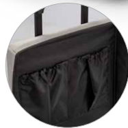
Poches intérieures Kleine interne Taschen