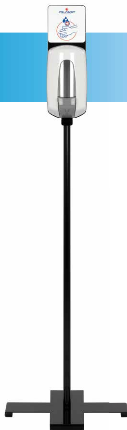
SLIM PLUS VERSIONE CON BASE A CROCE CROSS-BASED VERSION