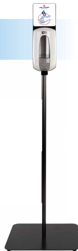
SLIM VERSIONE CON BASE QUADRATA SQUARE-BASED VERSION