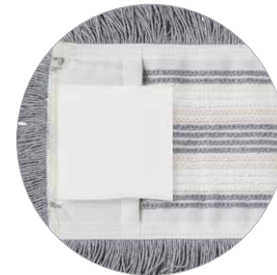
Tasche-alette Pockets and flaps