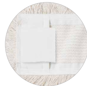
Tasche-alette Pockets and flaps